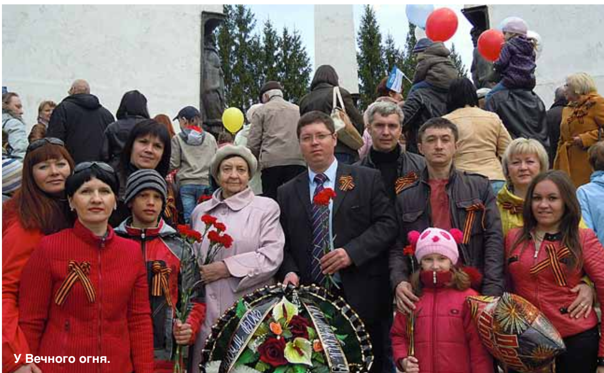
У Вечного огня.

1 мая работники Златоустовского Регионального управления приняли участие в городской демонстрации, посвященной празднику Весны и Труда. Многие взяли с собой детей и даже внуков – всеобщий праздник доставил удовольствие и взрослым, и детям.