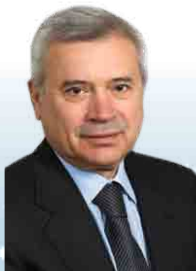
Президент ПАО «ЛУКОЙЛ» В. Ю. Алекперов

От всей души желаем вам в новом году профессиональных успехов, неисчерпаемой энергии, крепкого здоровья, мира и домашнего тепла, счастья и благополучия вашим семьям!